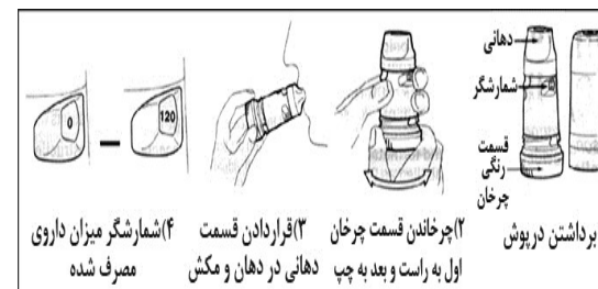
شکل ۵- نحوه استفاده از توربوهاالر دارویی (سیمیگورت، پالمیگورت، اکسیس)